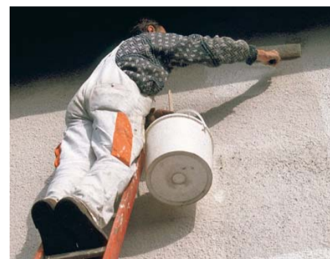
BUWAL / Docuphot. 2005