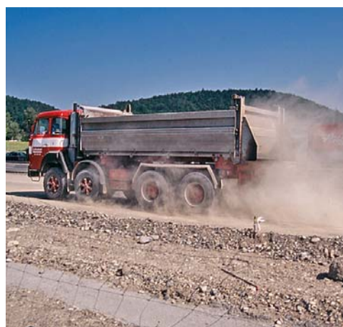
BUWAL / Docuphot. 2005